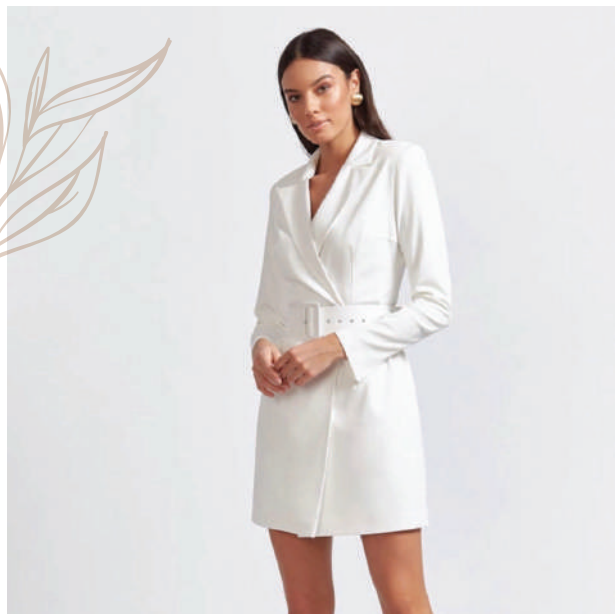
The Select Moscow